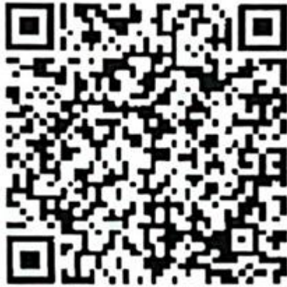
国家开放大学培训中心培训项目收款码